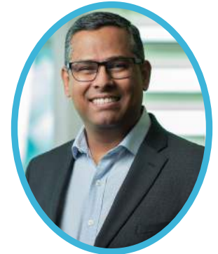
Presidente Adolfo Viramontes

Quiero dar las gracias a Gobierno del Estado por ayudar a la organización de este exitoso evento, nuestra intención es continuar con el networking de este tipo una vez al año para poder reunir a los principales Líderes de la Industria Aeronáutica.